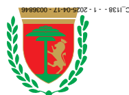
COMUNE di SANREMO